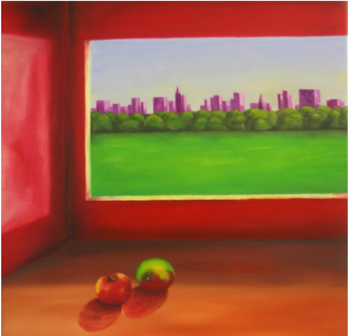
Alpha und Omega Serie Titel: „Arbeit 3/ CENTRAL PARK“ Herstellungsjahr: 2007 Medium: Öl auf 50cm x 50cm Leinwand