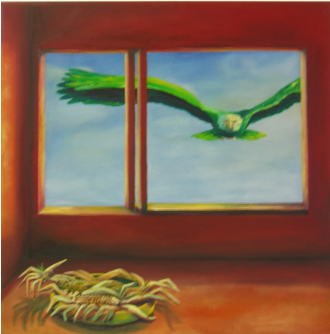
Alpha und Omega Serie Titel: „Arbeit 2 / DER VOGEL“ Herstellungsjahr: 2007 Medium: Öl auf 50 cm x50 cm Leinwand