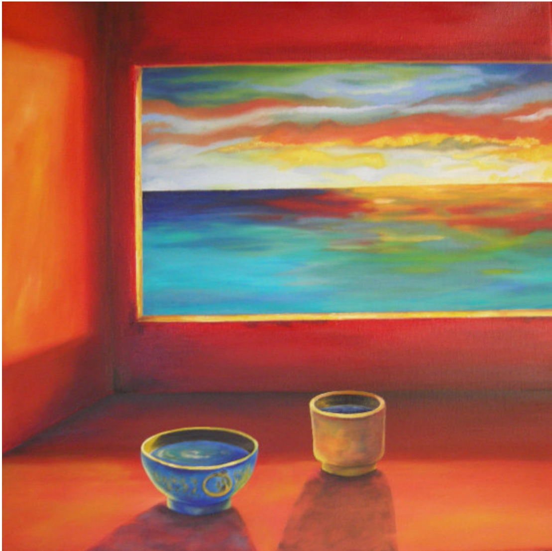
Alpha und Omega Serie Titel: „Arbeit 1 / UROBOROS“ Herstellungsjahr: 2007 Medium: Öl auf 50cm x 50cm Leinwand