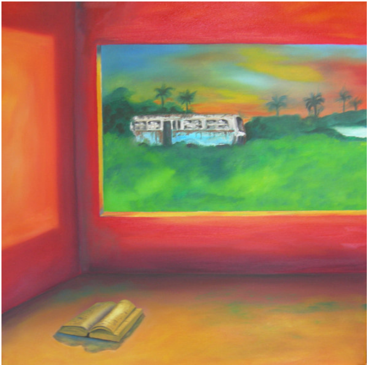
Alpha und Omega Serie Titel: „Arbeit 7 / BUS IN LOWLAND“ Herstellungsjahr: 2006 Medium: Öl auf 50 cm x 50 cm Leinwand