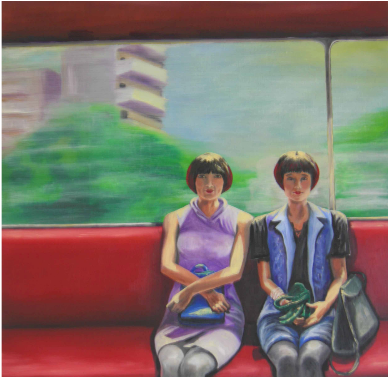
Alpha und Omega Serie Titel: „Arbeit 4 / Schwestern“ Herstellungsjahr:2007 Medium:Öl auf 50 cm x 50 cm Leinwand