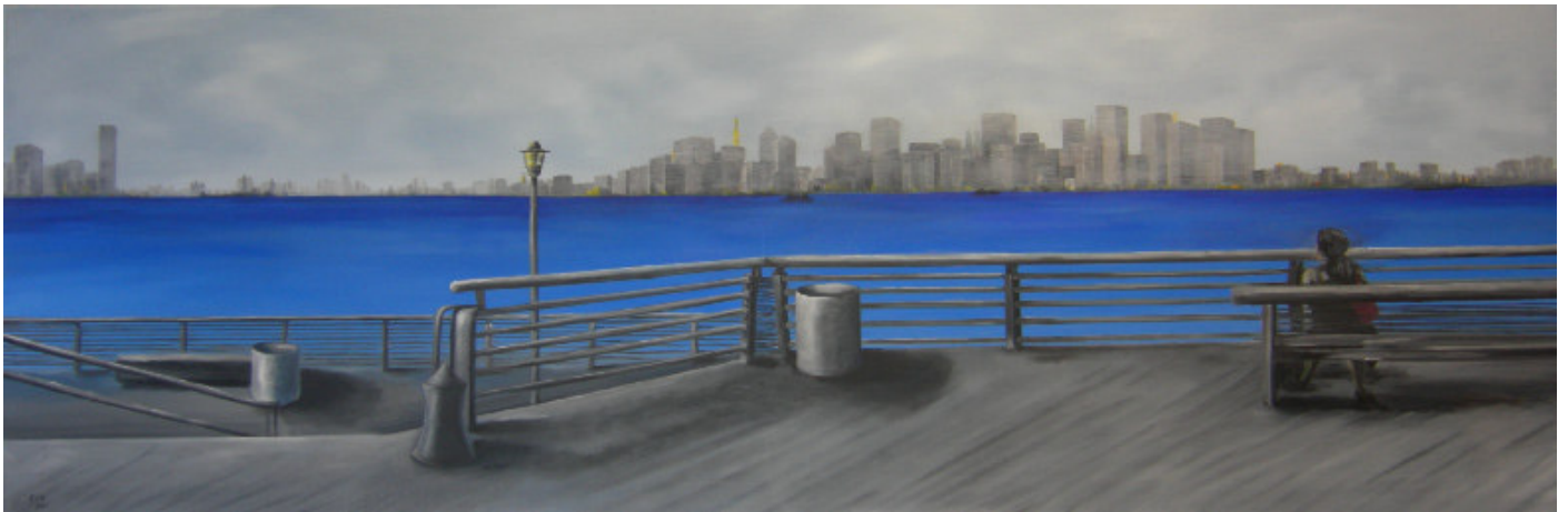
Alpha und Omega Serie Titel: „THE RIVER“ Herstellungsjahr 2006 Medium: Öl auf 150cm x 50 cm Leinwand