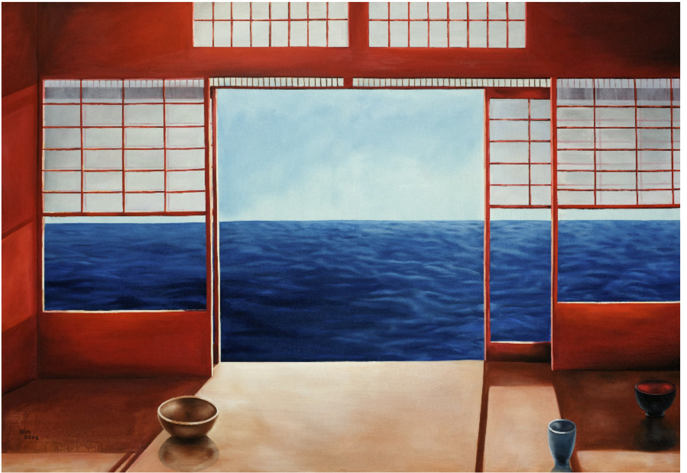
Alpha und Omega Serie Titel: „FENSTER AM MEER“ Herstellungsjahr: 2006 Medium: Öl auf 125cm x 180cm Leinwand