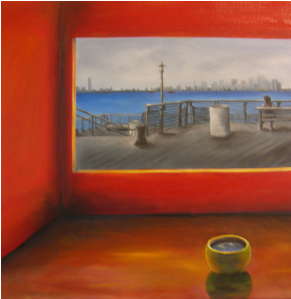
Alpha und Omega Serie Titel: „Arbeit 5 / HUDSON RIVER“ Herstellungsjahr 2007 Medium: Öl auf 50 cm x 50 cm Leinwand