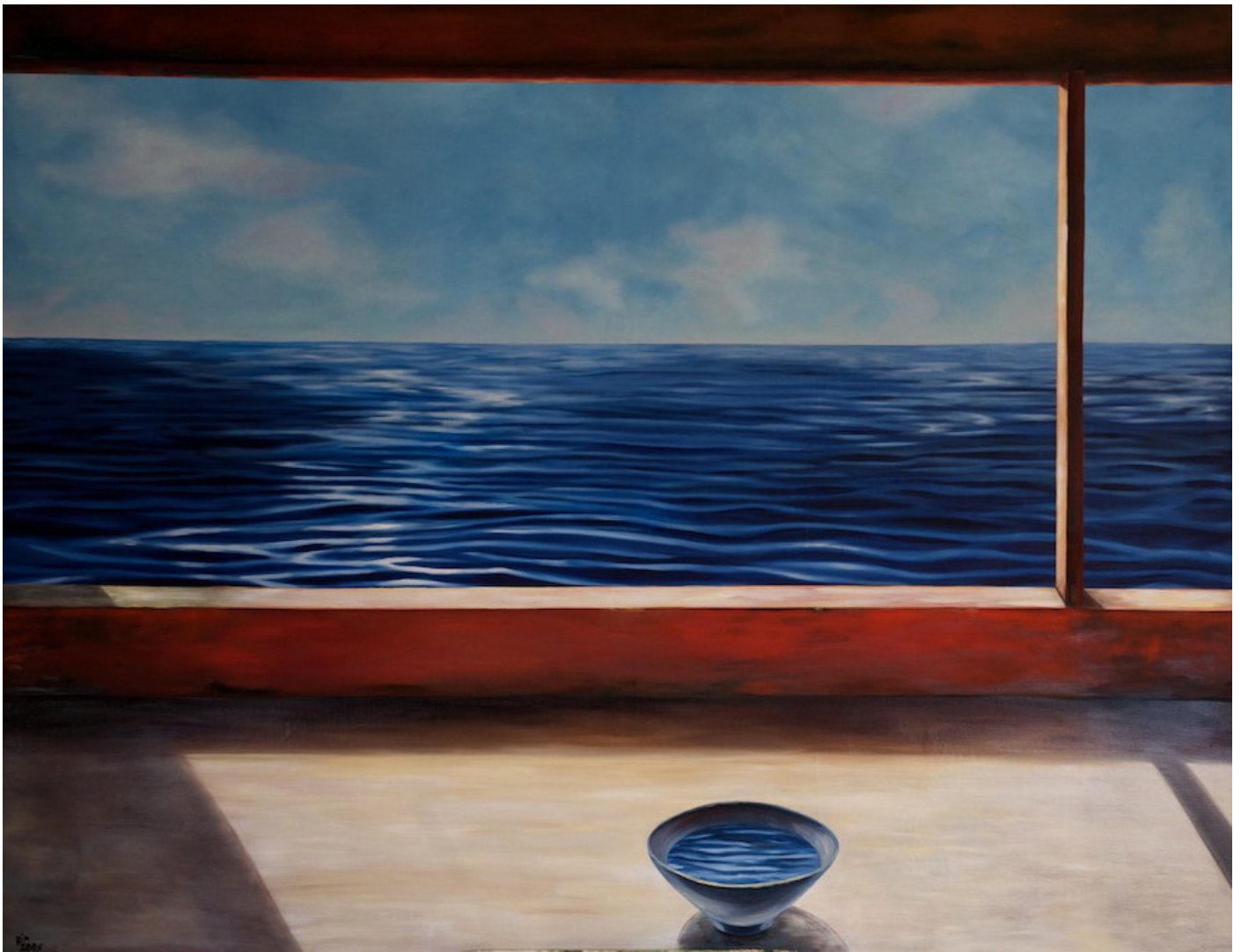
Alpha und Omega Serie Titel: „WHERE IS MY MIND“ Herstellungsjahr: 2008 Medium: Öl auf 140cm x 180cm Leinwand