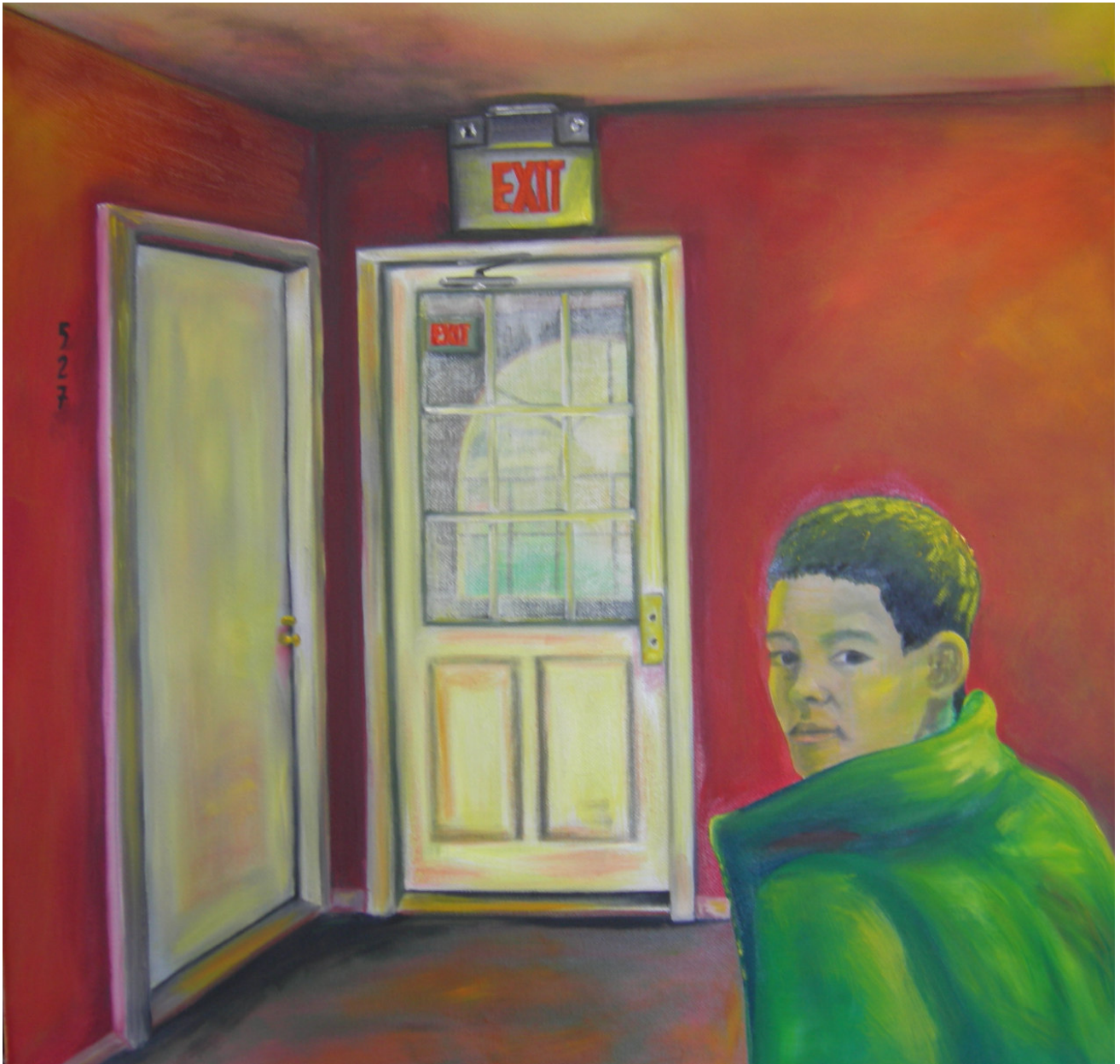
Alpha und Omega Serie Titel: „Arbeit 6 / EXIT“ Herstellungsjahr: 2007 Medium: Öl auf 50 cmx 50 cm Leinwand